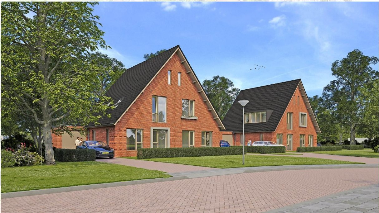
Woningtype 'Het Zigt'