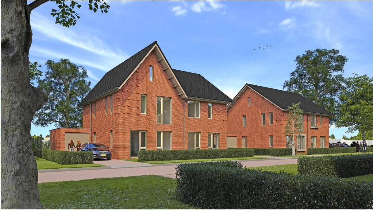
Woningtype 'De Zaaier'