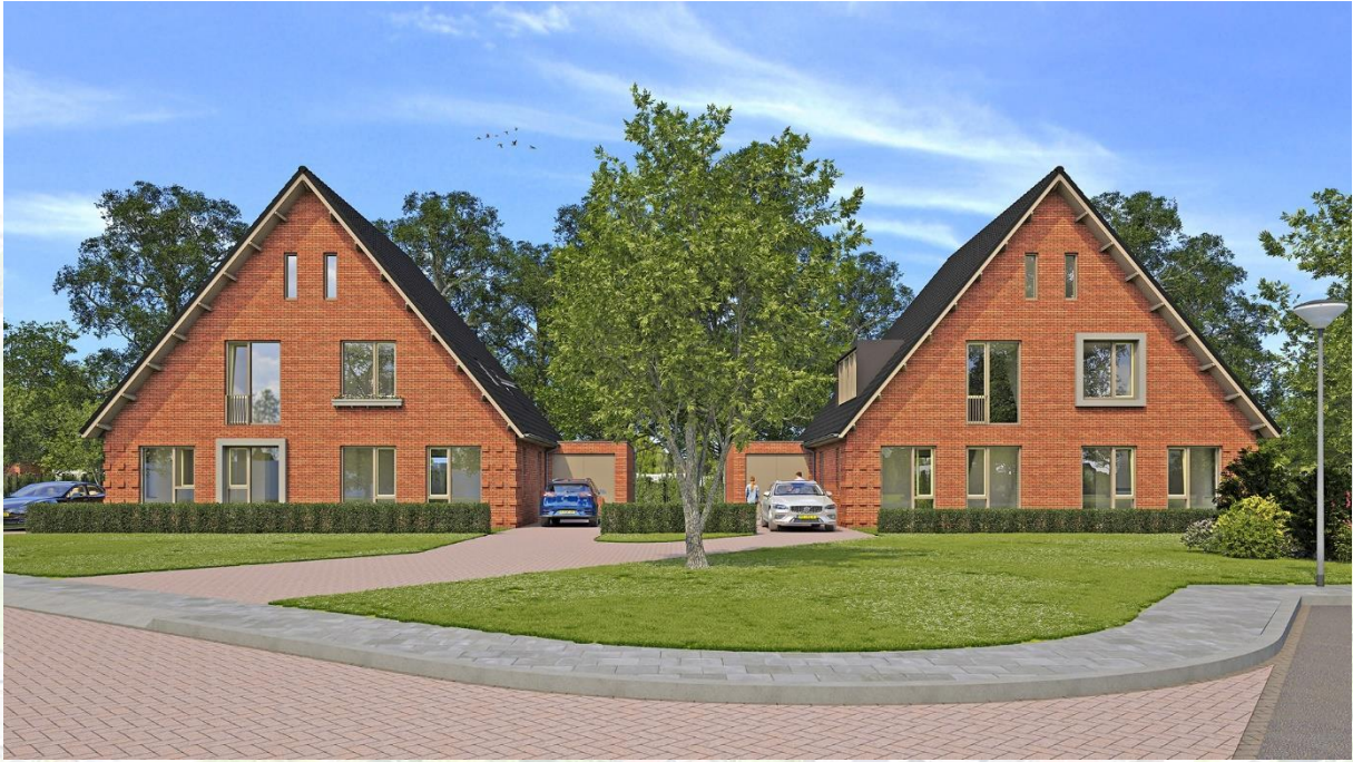
Woningtype 'Het Zigt'