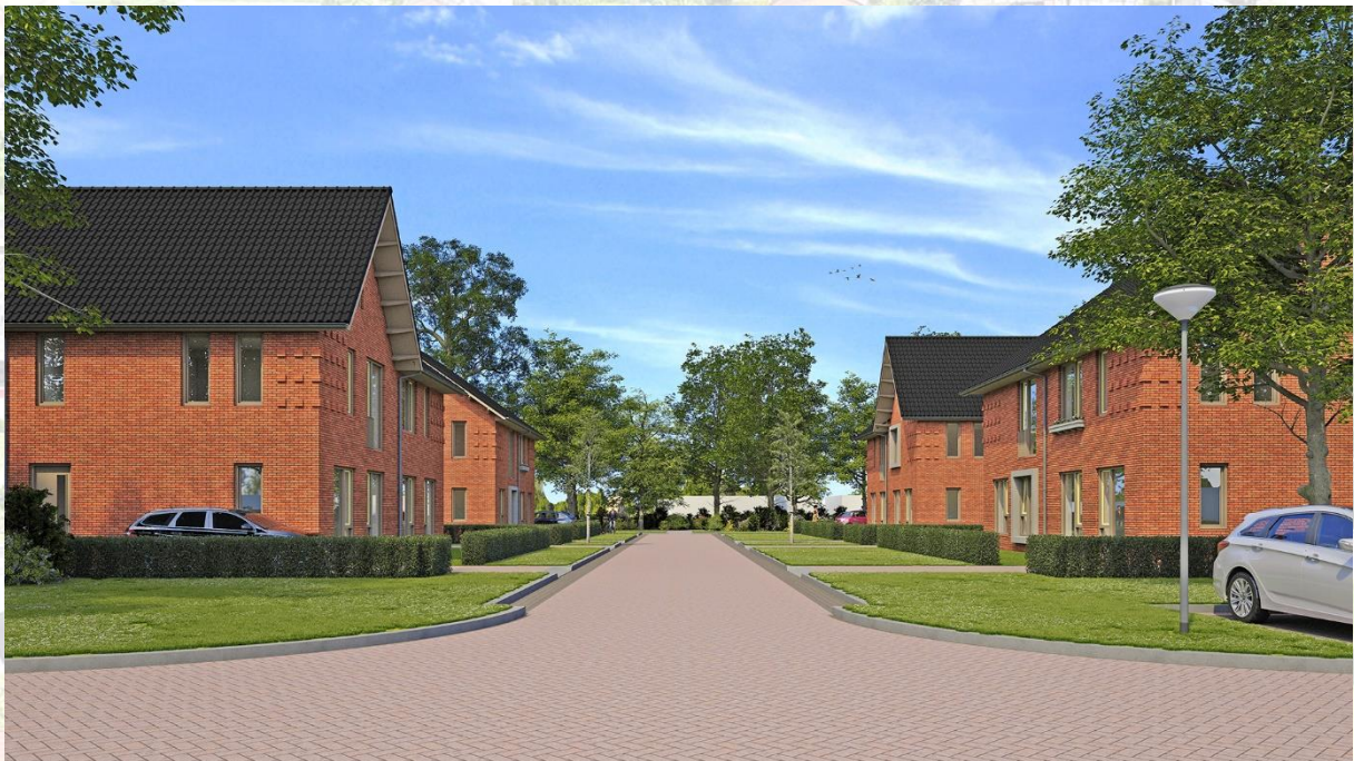
Woningtype 'De Zaaier'